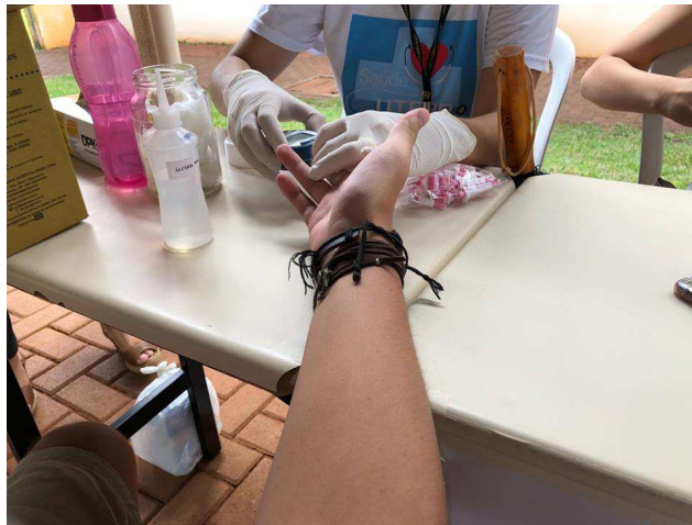
Figura 5 – Teste de glicemia realizado no dia 6 de março