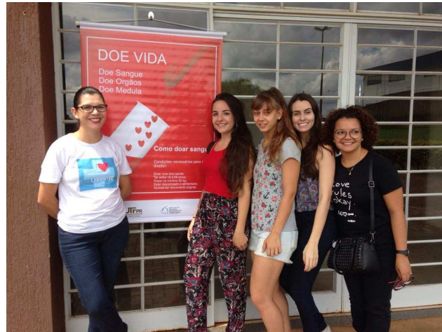
Figura 3 – Doadores do dia 14 de março