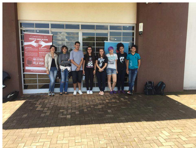
Figura 2 – Doadores do dia 31 de outubro