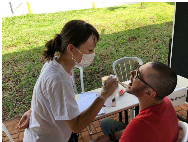
Figura 4 – Orientação bucal realizada no dia 6 de março