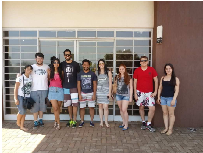
Figura 1 – Alguns doadores do dia 15 de setembro

As primeiras campanhas foram realizadas nos dias 15 de setembro, 31 de outubro e 14 de março (Figuras 1, 2 e 3), a metodologia usada para essas campanhas foi a seguinte: foi definida uma tarde, junto ao Hemonúcleo, onde o mesmo poderia buscar os doadores na universidade, foi aberto um formulário online para a inscrição e pré-triagem dos interessados na campanha e com isso realizou-se a doação de sangue. Foram levados ao Hemonúcleo em cada campanha 11, 8 e 4 doadores, respectivamente.