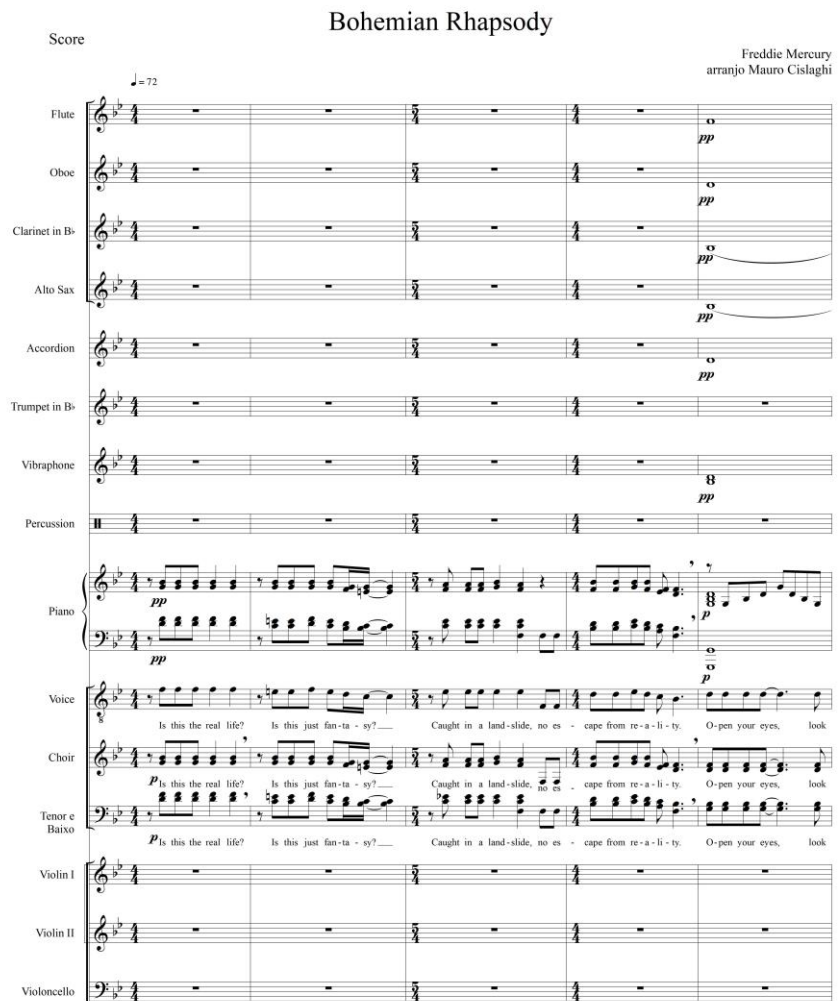
Figura 1: Exemplo de arranjo elaborado para a Orquestra e Coral da UTFPR – FB.

Como o enfoque foi no rock, este também exigiu por parte dos corralistas uma agressividade ao cantar, pois é um estilo que necessita de volume. Também foi feito uso de microfones para amplificar o som de cada música e trazer mais presença a cada apresentação, outros desafios se apresentaram ao decorrer dos ensaios, desde a parte de harmonizar o coral com a orquestra e os cantores convidados, algo que sai da zona de conforto. Entretanto mesmo com poucos ensaios com todos os envolvidos o resultado se mostrou muito bom, em grande parte ao profissionalismo e dedicação dos envolvidos.