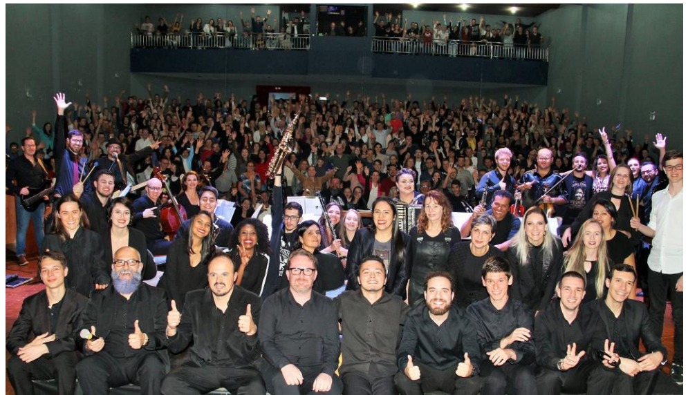
Figura 2: Rock in Concert, 28 de junho de 2019 em Francisco Beltrão.

Todo o esforço e dedicação dos envolvidos no evento fora recompensado com os aplausos fervorosos da plateia ao final de cada música, as coreografias de dança, que tiraram os coralistas de sua zona de conforto, foram um diferencial que elevou o nível da apresentação, tornando o “Rock in concert” um espetáculo que ficou marcado na história do coral e da orquestra da UTFPR.