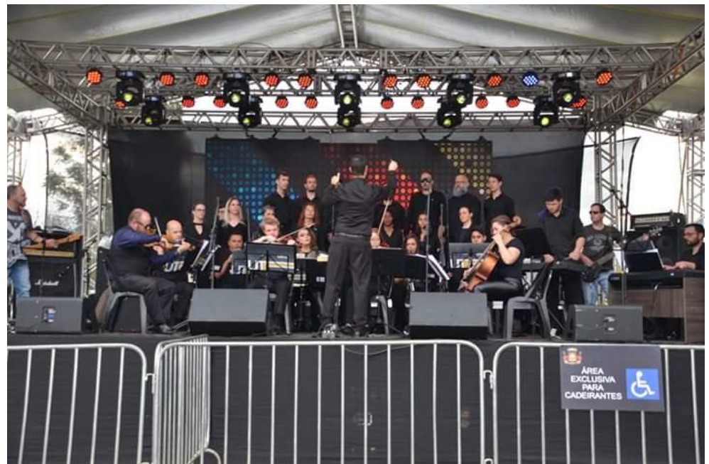
Figura 3: Beltrão Rock Culture, 13 de julho de 2019 em Francisco Beltrão.