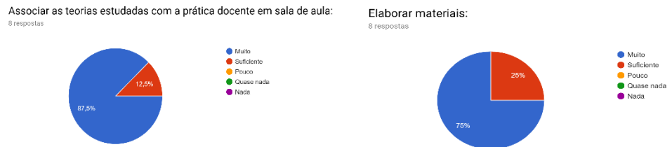
Figura 3 – Gráficos provenientes da pesquisa