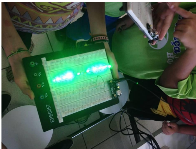
Figura 05 – Desenvolvimento das atividades em grupo.

Foi resolvido que seriam formados grupos de trabalho entre os alunos, para firmar o companheirismo e amizade dos mesmos, focando no trabalho em grupo e organização coletiva de cada um (Figura 05).