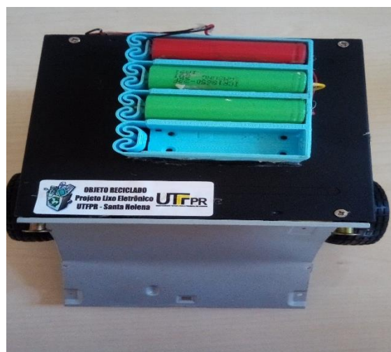
Figura 07 – Robô Bluetooth.