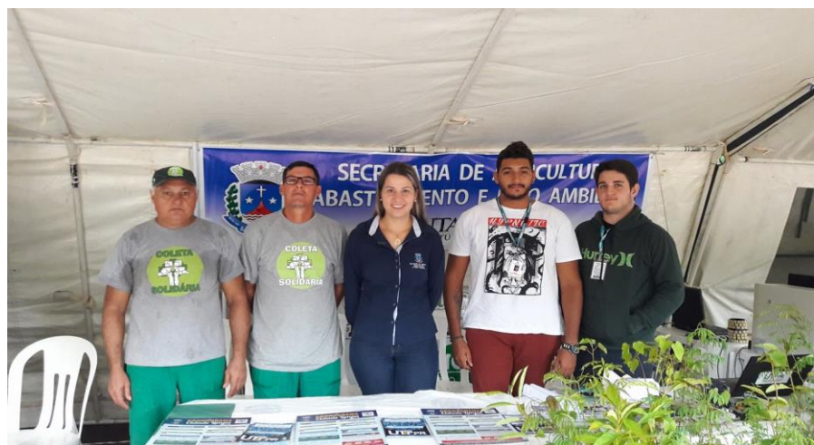
Figura 01 – Coleta de lixo eletrônico.

No processo de coleta, firmamos uma parceria com a prefeitura da cidade, onde duas vezes por ano ocorre a campanha da coleta de material eletrônico. Nesta coleta, levamos o material recuperado para expor e conversamos com a população sobre a importância de descartar corretamente o lixo eletrônico (Figura 01).