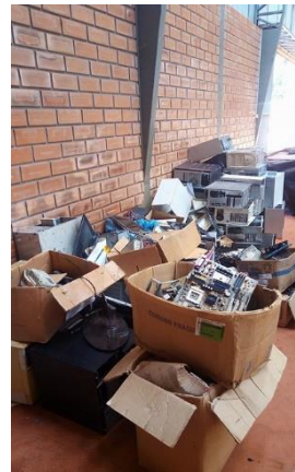
Figura 02 – Processo de triagem.

Um processo de triagem (Figura 02) dos produtos que chegavam era necessária, tendo em vista que muitos componentes ali no depósito não teriam mais funcionalidade e assim foram descartados para reciclagem pela empresa Krefta, de Foz Do Iguaçu.