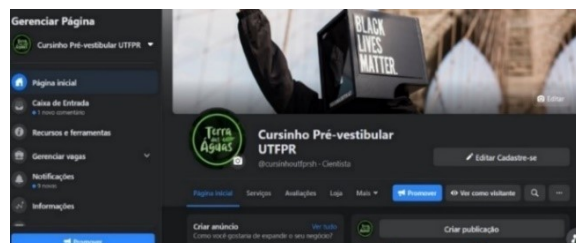
Figura 1. Pagina do Facebook

O uso de tecnologias proporciona um novo sentido em relação a comunicação no ambiente escolar e possibilita que alunos interajam e busquem informações com outros alunos do mesmo colégio, estado ou do exterior, da maneira que achar necessário. Deste modo, as redes sociais, como Facebook e Instagram , se tornaram fundamentais para a divulgação de eventos científicos, simulados online preparatórios para o ENEM, divulgação dos trabalhos internos e externos da Universidade, entre outros. A condição de pandemia e Governo Federal ter adiado a data do Enem fez com que diversas ideias planejadas para o projeto, fossem interrompidas e reformuladas. Algumas ações foram inseridas no planejamento, como fatos históricos ocorridos em 2020, a exemplo da campanha “ Black Lives Matter ”, que tomou força e comoção mundial, após o assassinato de George Floyd em decorrência de mais um caso trágico de racismo (Figura 1 e 2).