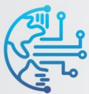
Figura 2 – Imagens utilizadas na divulgação do Podcast. a) Primeiro episódio; b) Segundo episódio; c) Terceiro episódio