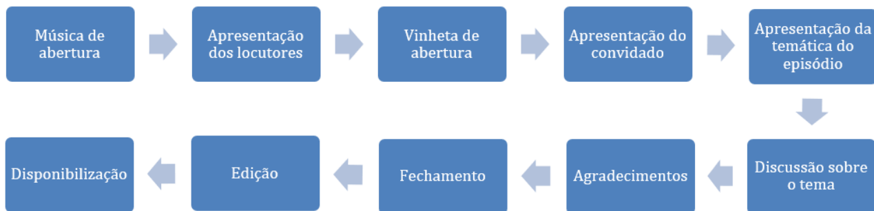
Figura 1 – Fluxograma das etapas do roteiro

Os Podcasts foram produzidos no período de junho a agosto de 2021. As etapas necessárias, desde a definição do tema até a disponibilização mensal de cada episódio, são detalhadas na Figura 1. Destaca-se que tal modelo de roteiro foi ajustado para todas as temáticas.