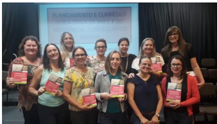
Figura 3 – Algumas colaboradoras do livro “Formação Continuada e seus Desdobramentos”